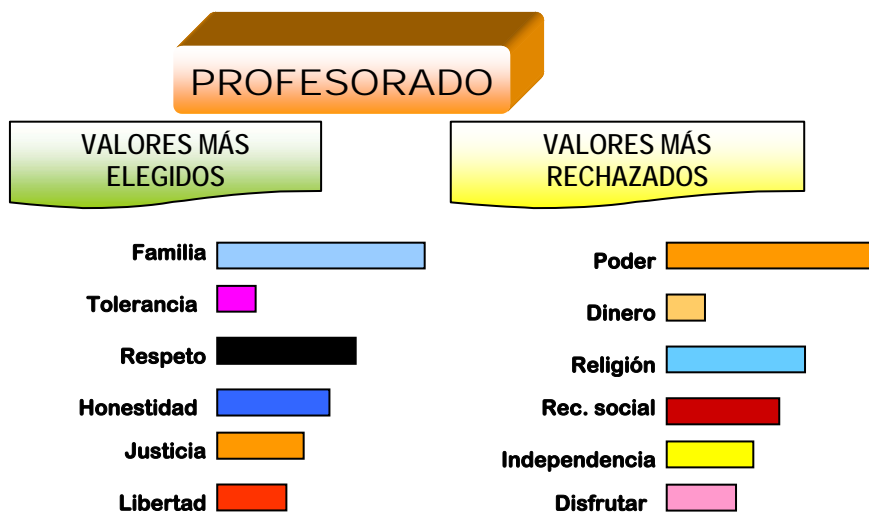
Gráfico 3. Valores más aceptados y rechazados por el profesorado