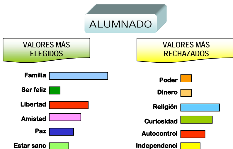
Gráfico 1. Valores más aceptados y rechazados por el alumnado

El siguiente valor más elegido es el ser feliz elección acorde con la cultura occidental en la que se prima la búsqueda de la satisfacción y realización individual, por encima de los valores comunitarios de hace dos décadas. La preocupación de los jóvenes parece estar más comprometida con cubrir y satisfacer sus necesidades individuales que contribuir, con su esfuerzo a la mejora de la sociedad. La libertad es el tercer valor más elegido, lo que confirma la búsqueda del desarrollo de su propia individualidad. Pensar, actuar según su libre albedrío, sin condicionantes que los obliguen a actuar en contra de sus necesidades y metas. El cuarto valor más elegido es el tener amigos, priorizando el establecer con sus iguales una relación positiva y de aceptación. La paz es el quinto valor más elegido y parece tener una relación con la necesidad de seguridad del ser humano. La inestabilidad mundial está afectando a nuestros alumnos, que se muestran preocupados de que el mundo no sea capaz de vivir en paz. Sin embargo, esta preocupación parece más vinculada a la necesidad de un mundo seguro “para mi y mi familia” que al compromiso con valores de solidaridad o justicia. Esta reflexión viene abalada por el hecho de que el sexto valor más elegido es el estar sano. Relacionando estos cuatro valores, observamos un perfil muy acorde con nuestra cultura occidental: jóvenes que desean vivir tranquilos, arropados por su familia, buscando su bienestar individual.